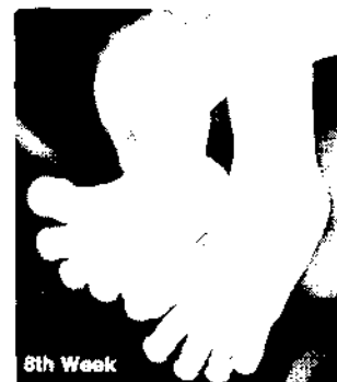
8. Woche Bestellnummer 2