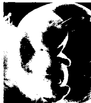
7. Woche Bestellnummer 1

M & I - Redaktion: Was wäre passiert, hätte diese „Ärztin“ nicht vom Gesetzgeber die Erlaubnis gehabt, dem jungen Mädchen die Tötung ihres Kindes anzutragen? Sie hätte vielleicht ein ernsthaftes Gespräch mit den Eltern oder nach einer anderen Alternative gesucht, so wie es einem Arzt immer gut ansteht, zu helfen, zu heilen und nicht zu töten - auch nicht zum Töten zu überweisen.