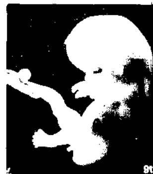
9. Woche Bestellnummer 3 Farbfoto 20 x 30 (siehe auch Seite 54)