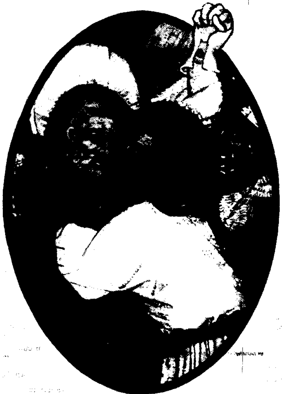
Der Judaskuß, Glasfenster aus der Besserer-Kapelle im Ulmer Münster von Hans Acker von Ulm, 1430 n. Chr.