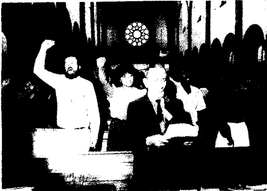
"Notstandskonferenz" in Harare (Simbabwe), Mitglieder der südafrikanischen Delegation. Im Vordergrund der Generalsekretär des Ökumenischen Rates der Kirchen (ÖRK), Emilio Castro.