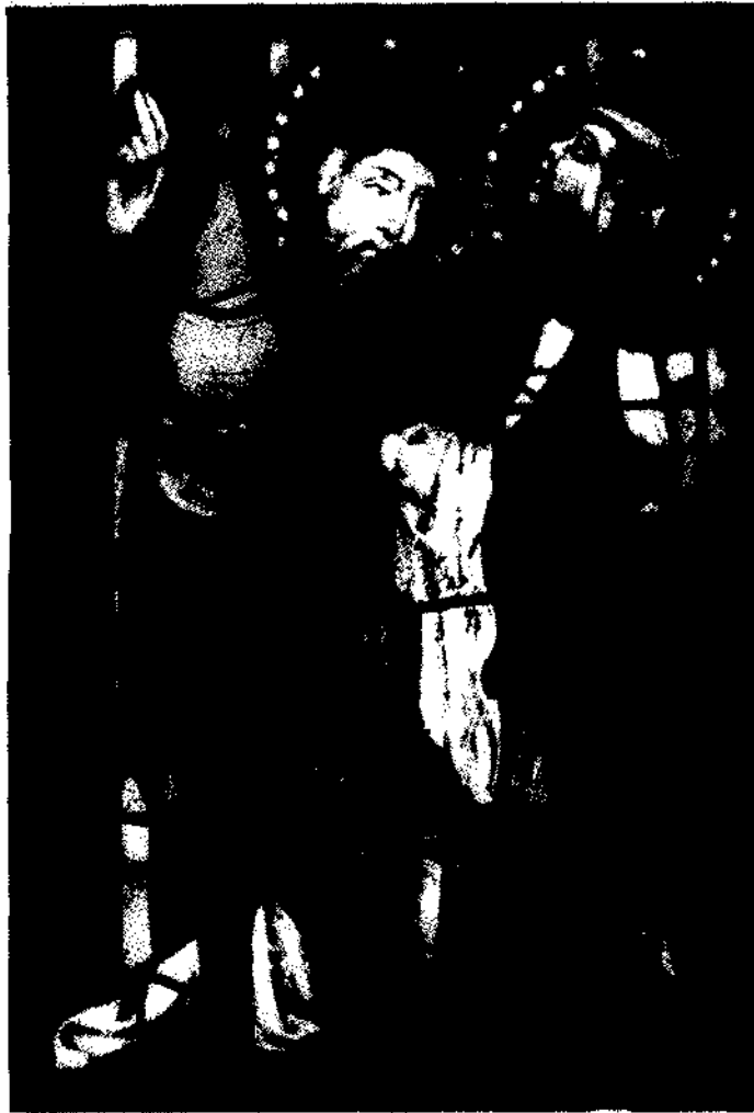
Der weiße König zeigt dem schwarzen König den Stern von Betlehem.